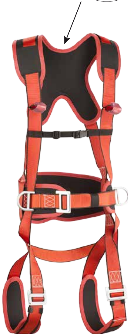
Nº2: Punto de enganche frontal (A/2) Chest anchoring point (A/2)